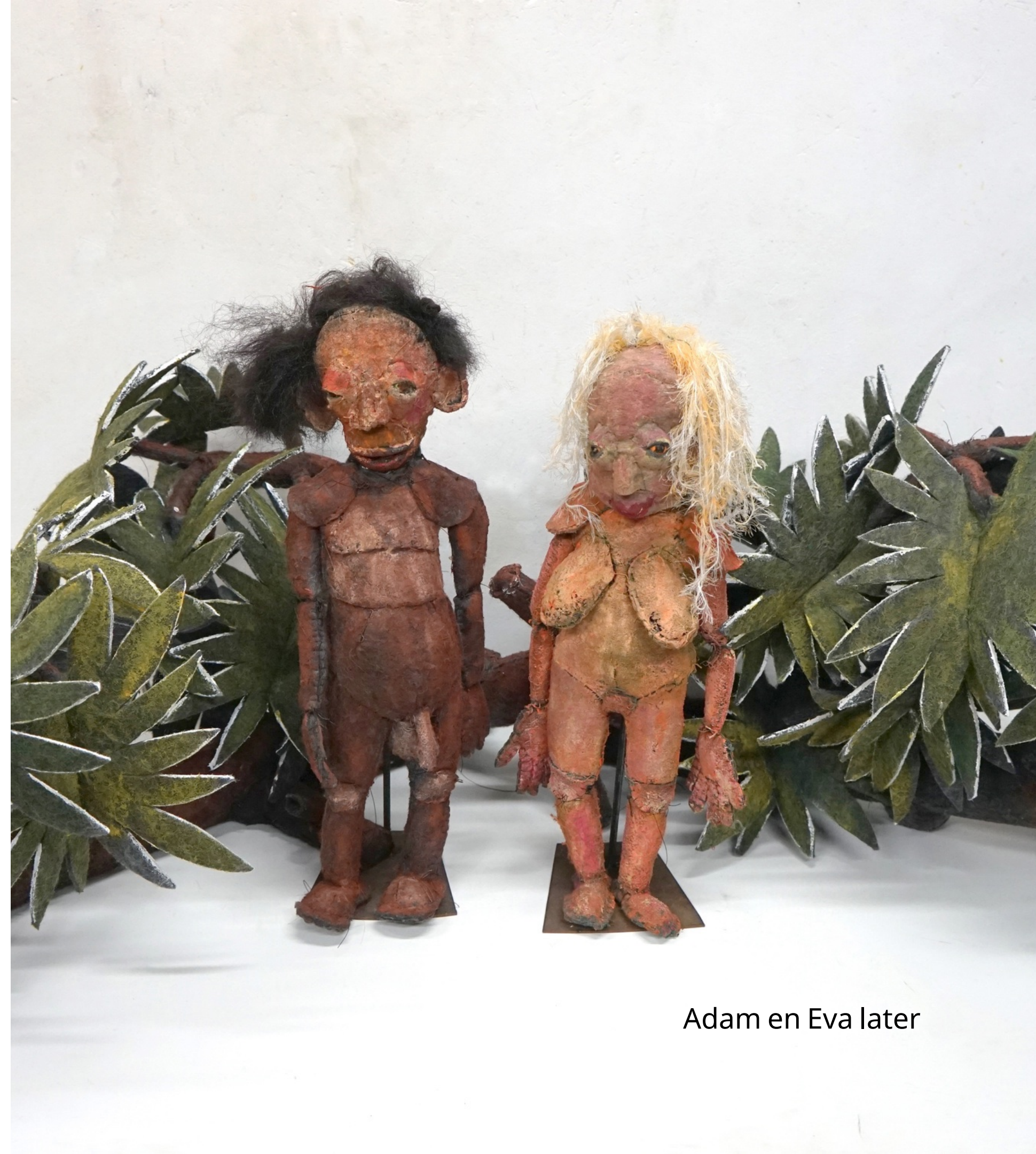
Adam en Eva later